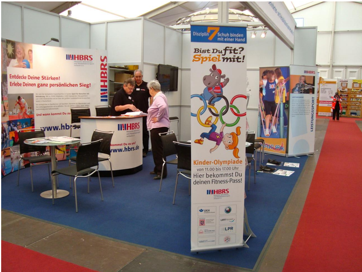
HBRS-Stand-Übersicht mit Plakat der Kinder-Olympiade der Unfallkasse Hessen