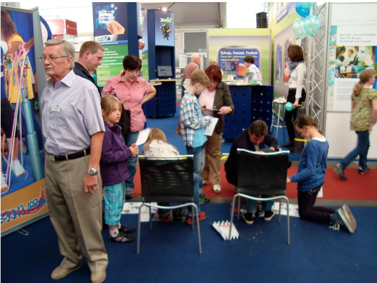
Großer Andrang zum „Schuhe binden mit einer(!) Hand“, die Kinder-Olympiade wurde gut angenommen.