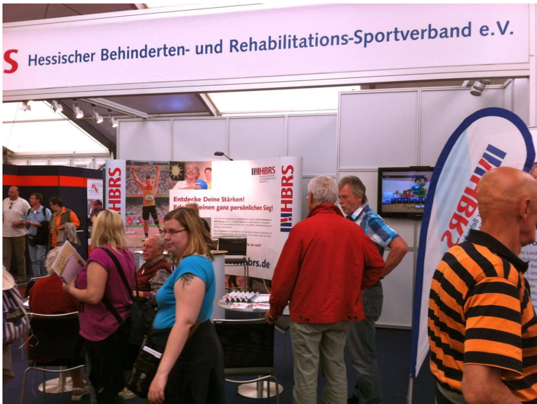
Der Stand ist am Samstag, dem 2.6. gut besucht. Auch das Wetter spielt mit.