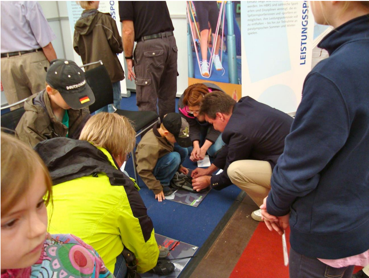
Manches geht nur mit Hilfe, vor allem wenn man überhaupt noch keine Schuhe binden kann!