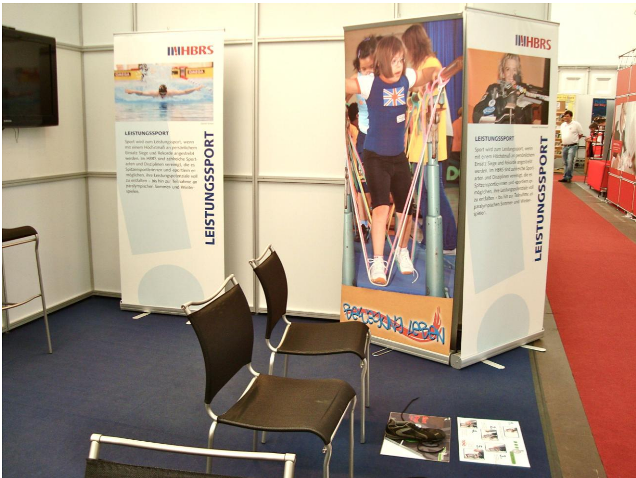
Leistungssport und Behinderung schließen sich nicht aus!